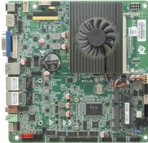
ITX-B430_I526L VER:1.6 主板正面图